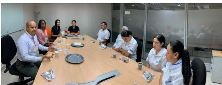
ALIMENTOS CÁRNICOS DOSQUEBRADAS