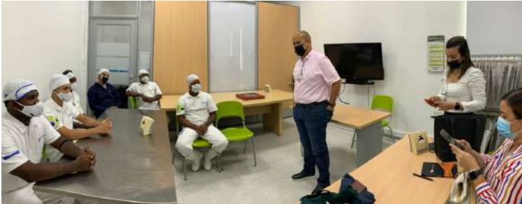
GESTIÓN CARGO CARTAGENA