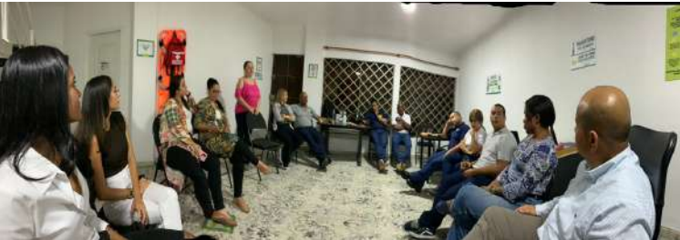
GRUPO ADMINISTRATIVO SEDE SUROCCIDENTE