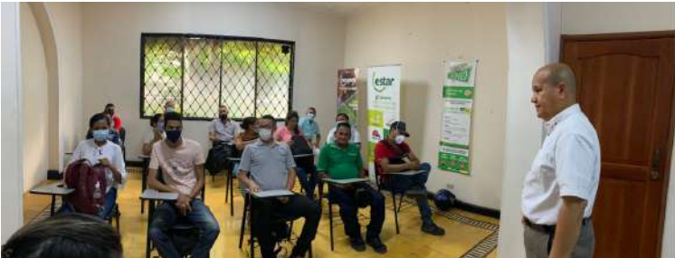
GRUPO ADMINISTRATIVO SEDE REGIONAL NORTE