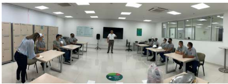
COMERCIAL NUTRESA BARRANQUILLA