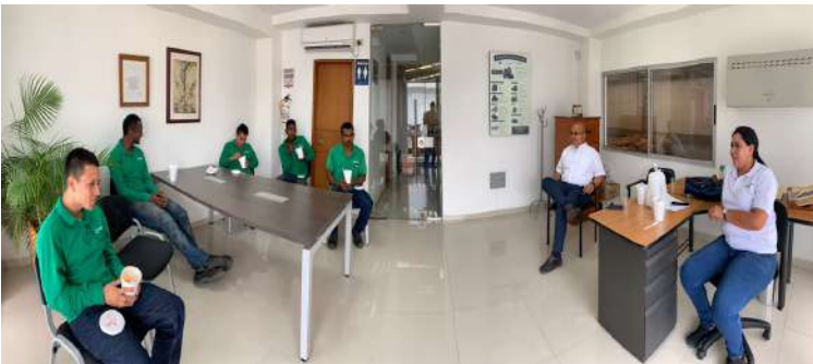
NACIONAL DE CHOCOLATES BUCARAMANGA