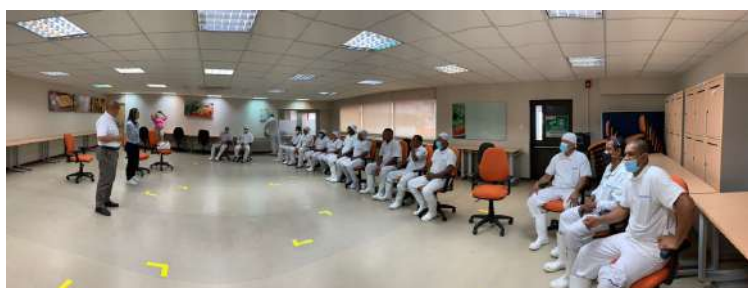
ALIMENTOS CÁRNICOS BARRANQUILLA