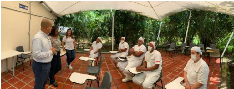
MEALS DE COLOMBIA EN LATEBAIDA