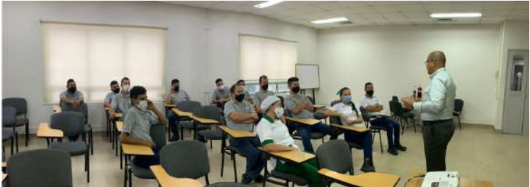
GRUPO COMERCIAL NUTRESA BUCARAMANGA