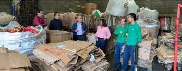
FUNDACIÓN ÉXITO PEREIRA