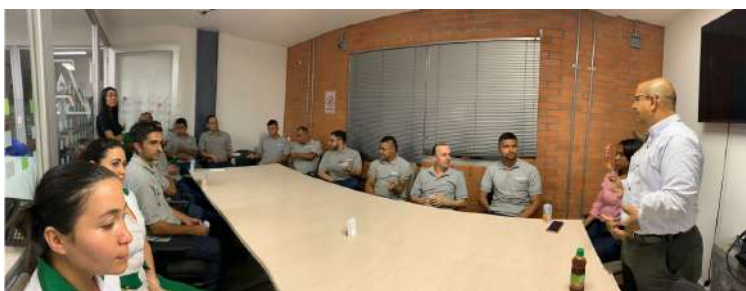
COMERCIAL NUTRESA PEREIRA