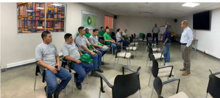
COMERCIAL NUTRESA YUMBO