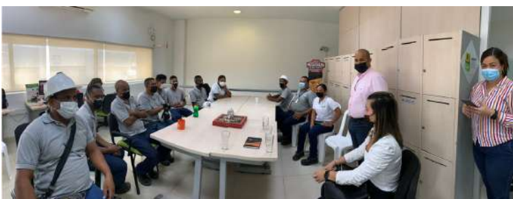
COMERCIAL NUTRESA CARTAGENA