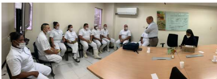
CEDÍ CÁRNICOS CALI